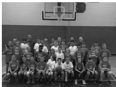
Été 2019 – 19 au 23 août 2019