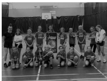
Camp 2021 – Groupe de filles 16 au 20 août 2021

asteriesdirection@gmail.com https://www.asteriebasketball.com/