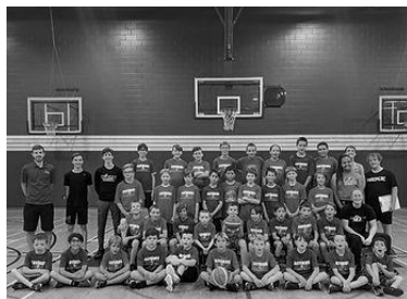
Camp 2022 – Groupe de gars Juin 2022